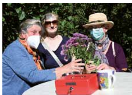
Auch mit Maske lässt es plaudern...

Viele Vereinsmitglieder und Besucher aus nah und fern nutzten die Pflanzenbörse zum Tauschen und Fachsimpeln. Diesmal feierte man mit der 25. Börse ein kleines Jubiläum, das allerdings infolge der Corona-Regeln bescheiden ausfiel. War es im vergangenen Jahr die Herbstkälte, die nur wenige Besucher anlockte, zeigte sich die Viertel-Jahrhundert-Börse im herbstlichen Sonnenschein, der zum Plausch unter der Maske lockte. umf.